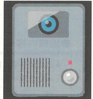
カメラ付き インターホン