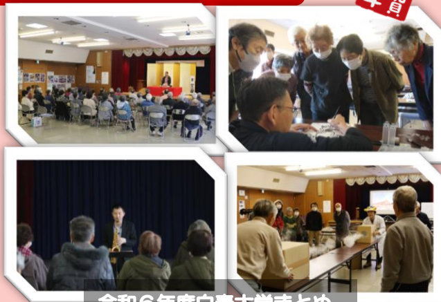
令和6年度白寿大学まとめ