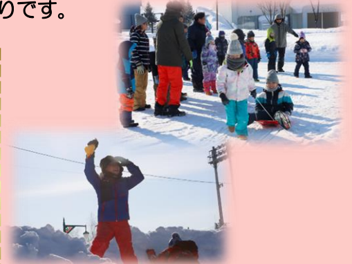
令和5年度比子連スノーフェスティバルの様子