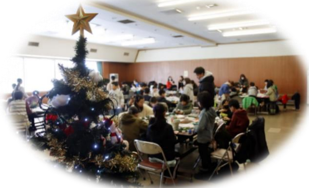
12/14 比子連クリスマスパーティ