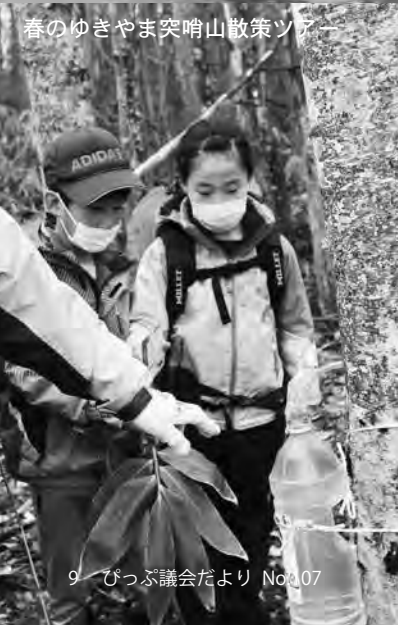
春のゆきやま突哨山散策ツアー

【建設課長】毎年、広報紙で周知しています。暖気による落雪の処理を有料で行うことはありますが、道路に出した雪の処理で料金をいただくのは難しいと考えます。