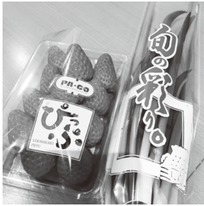
冬いちごと千本ねぎ

■地方創生臨時交付金事業 ◇「支え合おう！ぴっぷの元気づくり商品券」給付事業 商品券利用率98・7%、食事券利用率95・6%（最終実績）