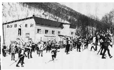
スキー客でにぎわうほくれいロッジ

昭和42年、札幌の冬季オリンピック（47年）をひかえ、スキー熱が高まり始めた当時、7線の比布沢に「比布沢国際スキー場」が開設されました。