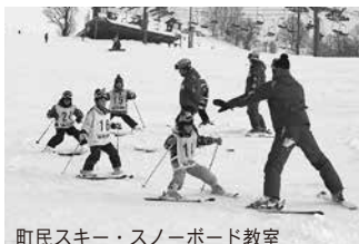
町民スキー・スノーボード教室