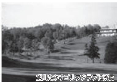
旭川たかすゴルフクラブに所属

このコーナーは、生涯現役で活躍している町内の高齢者を紹介します。皆さんからのご紹介もお待ちしておりますので、役場総務企画課広報係までご連絡をお願いします。