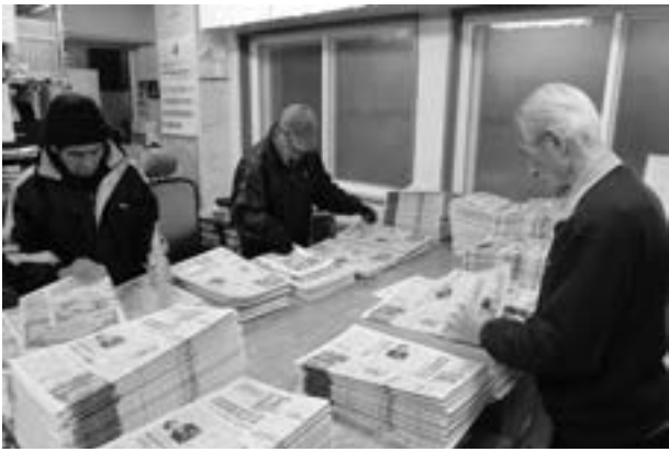
手早くチラシを折り込んでいく