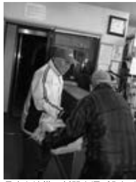
見事な連携で新聞を運び入れる

午前2時半。寝静まった商店街にただ一つ明かりが灯る店がある。朝刊の配達を準備する上西新聞店だ。