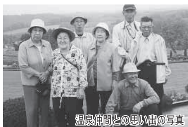
温泉仲間との思い出の写真

大正15年、比布村出身。比布東園尋常高等小学校卒業後は農業に従事。また、昭和49年まで山から馬で木材を運ぶ馬搬も行っていた。