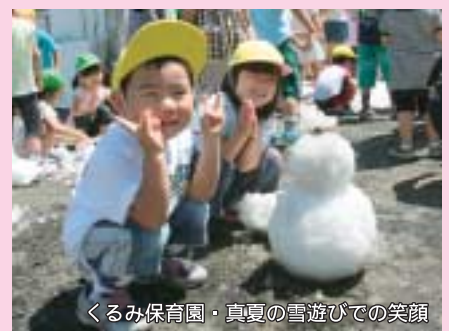
くるみ保育園・真夏の雪遊びでの笑顔

今月号の表紙は、町民の皆さんから募集した写真を掲載しました。30人のかわいらしい笑顔が並び、見ている私たちも思わず、ほほ笑んでしまうような写真ばかりです。「笑顔があれば自分が、相手が、運命が変わる」。皆さんの笑顔は町の宝。新しい1年も笑顔の花咲く比布町となるよう、町の話をお伝えしていきます。