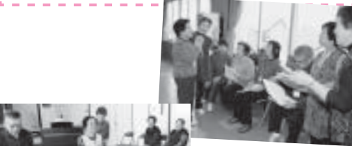
▲ ふまねっとサポーター勉強会の様子

「ふまねっとピ」では、要請に応じて地区や団体でふまねっと運動体験会を行います。まずは、体験をして、楽しんでください! 少人数でも実施できますので、ふまねっとピの事務局である当センターまで、ご相談ください。 あなたの地域(団体)でも、ふまねっと運動をしてみませんか?