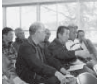
▲東園地区の懇談風景

南分館周辺は素掘りで、 春の雪解け水や夏場の 大雨等で土砂が崩れ、周辺の 畑にも水が入り大変困ってい