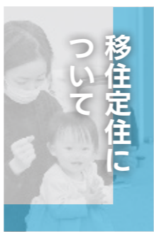
移住定住について

A 令和5年3月末時点の庁舎等整備基金の残高は200,779千円です。庁舎建替に伴う増税は行いません。行政DX