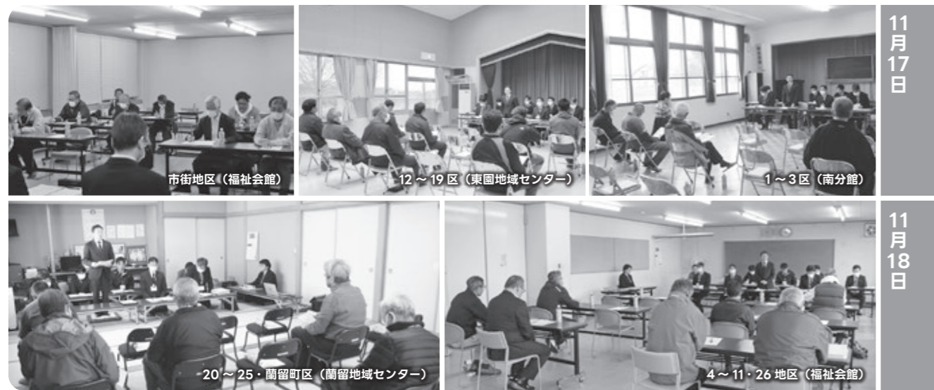
5地区で開かれたまちづくり懇談会の様子▼

(※1) 行政DX(デジタルトランスフォーメーション)とは、情報システムの標準化などITやテクノロジーを活用し、利用者中心の行政サービスの維持と向上を目指す取り組みのこと。 (※2) 提案型プロポーザル方式とは、複数の企業の中から最も優れた提案をした企業を契約の候補者として選定する方式のこと。