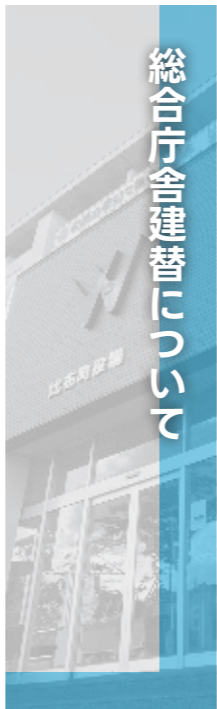
総合庁舎建替について

今年は「総合庁舎建替」「移住定住」についてテーマを設定し、それぞれの地域からご意見を伺いました。