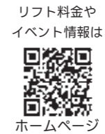
リフト料金やイベント情報は ホームページ