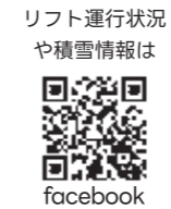
リフト運行状況や積雪情報は facebook