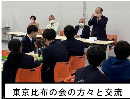
東京比布の会の方々との交流