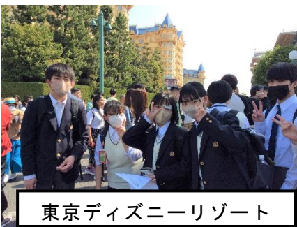
東京ディズニーリゾート