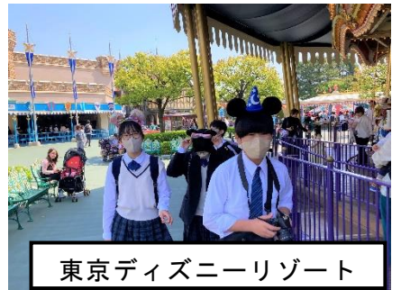
東京ディズニーリゾート