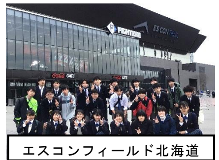
エスコンフィールド北海道

5月17日(水)には、その内容や成果を発表するために、修学旅行報告会を実施しました。5～8年生の児童生徒や9年生保護者など、たくさんの方々に聞いていただくことができました。その中で、今まで積み重ねてきたプレゼンテーションの力を、十分に発揮することができました。また、今回の取組を通して、自分たちはたくさんの方に助けられ、支えられているということ、9年生は実感したと思います。