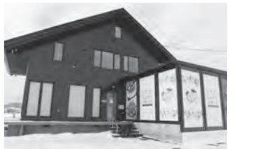
新規出店「いちごとKaoriと洋菓子店」