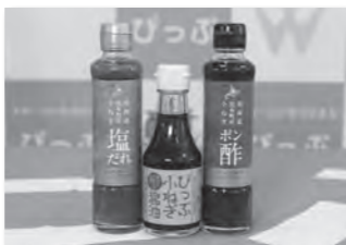
小ねぎシリーズ(3本セット)