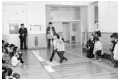
くるみ保育園交通安全教室 (H25. 5. 1)

■交通安全対策事業 313 万円 交通安全運動の推進を図ります。また、危険と思われる交差点に注意を促す看板などを設置するとともに、交通安全協会の運営を支援します。