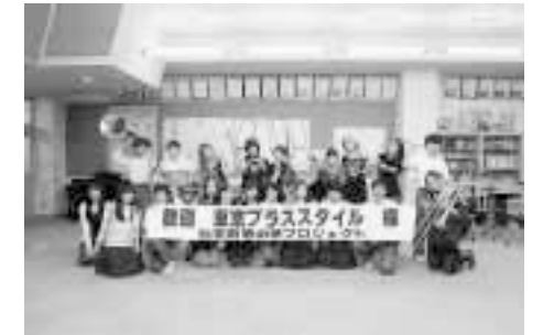
君の夢プロジェクト吹奏楽部編 (H25. 9. 20)

■君の夢プロジェクト推進事業 200 万円 子ども達が通常では体験できない本物の舞台や技術指導を体験することで、夢を持って学校生活を過ごすとともに、故郷「比布町」に誇りを持ってもらえるような感動づくり事業を行います。