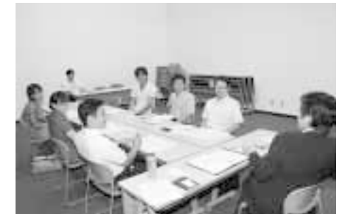
まちづくりリーダー育成事業

■まちづくりリーダー育成事業 33 万円 一般成人を対象に、町の課題をテーマとした講座を開設します。