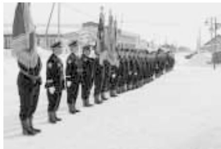
消防団出初式 (H26. 1. 7)

■消防団員安全装備品整備事業 消防団員が災害活動時に安全に活動ができるように防火衣を2か年かけて更新します。