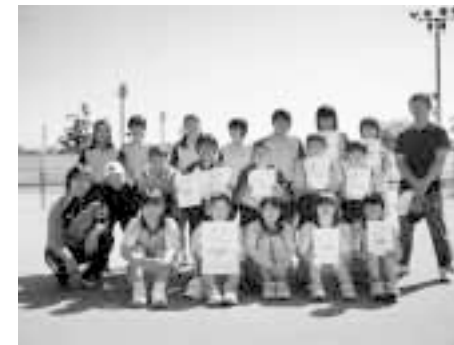
中体連上川中央地区大会 (H25. 6. 28～29)

■小・中学校特別活動等事業 170 万円 小・中学校の特別活動やスポーツ少年団、部活動などに対して支援します。