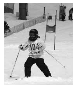
教育委員会スポーツ振興係

ボード・スノースケートの部/スキー場ダイナミックコース/午前11時30分 □ペアスキー競技/スキー場ダイナミックコース/午後0時25分 なお、悪天候などのやむを得ない理由により大会を中止する場合は、大会当日の午前7時30分ごろに防災行政無線でお知らせします。