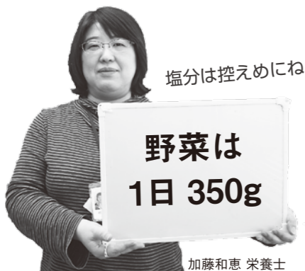
塩分は控えめにね!