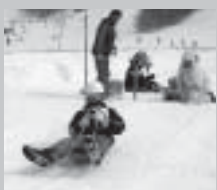
▲プラスチックそり最速王決定戦の様子

第7回ぴっぴチャレンジ☆パラダイスが、2月26日(日)に開催されます。プラスチックそり最速王決定戦や宝さがしなど、ほとんどが事前申し込みのない競技ばかりです。みなさん、遊びに来てください。