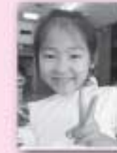
※表紙イメージ(実際はカラーになります)