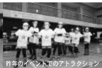
昨年イベントでのアトラクション