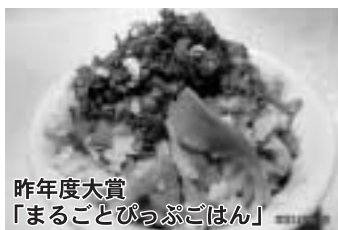
昨年度大賞「まるごとぴっぷごはん」