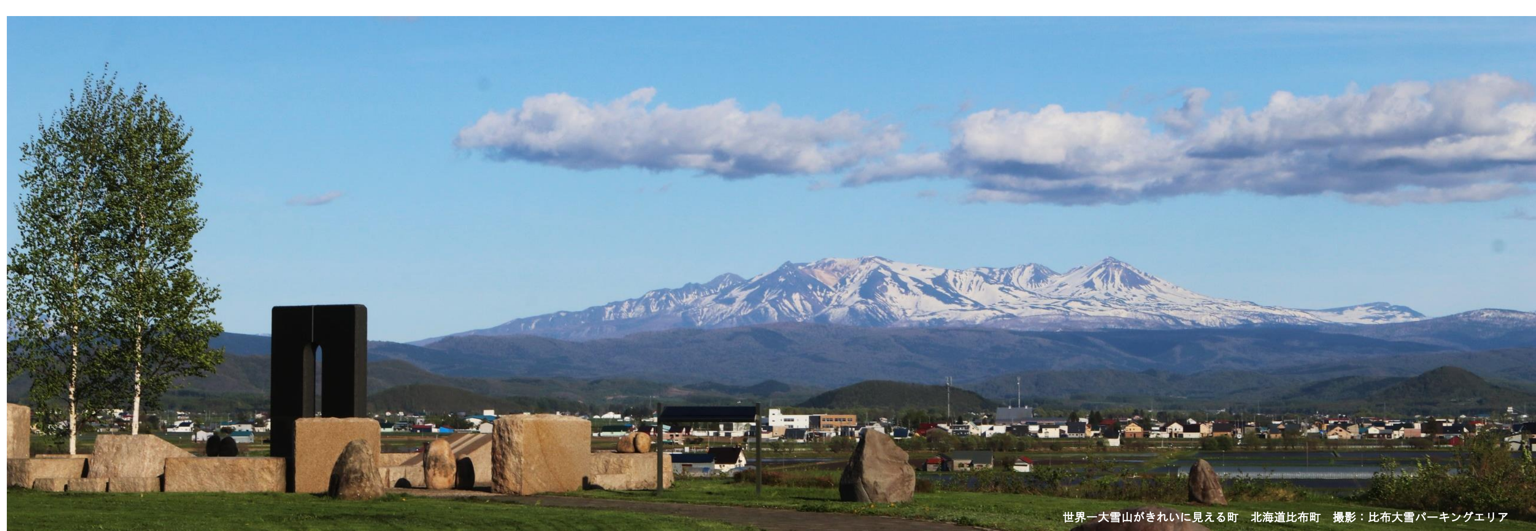
世界一大雪山がきれいに見える町 北海道比布町 撮影：比布大雪パーキングエリア