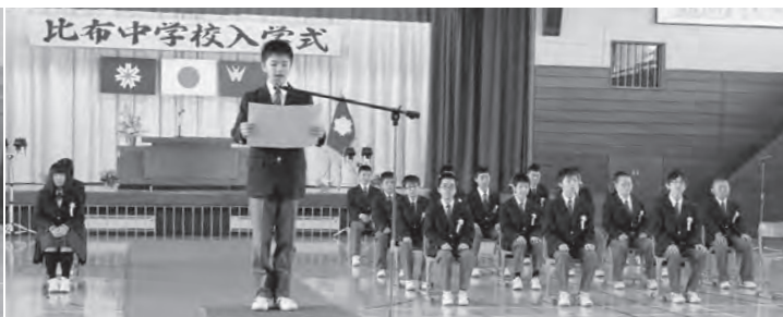
4 / 7 比布中学校 入学式