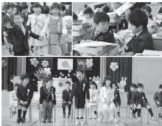
4 / 7 中央小学校 入学式

中央小学校に24人、比布中学校には27人が入学。また、くるみ保育園には81人（1歳～5歳児合計）が入園しました。ピカピカの洋服や真新しい制服に身を包んだ新入生たちは期待と希望に胸をふくらませながら、新しい学び舎の門をくぐりました。