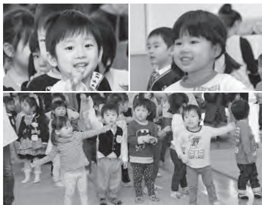
4 / 1 くるみ保育園 入園式